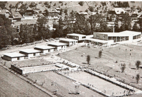
Die Badi Langnau im Jahr 1971...