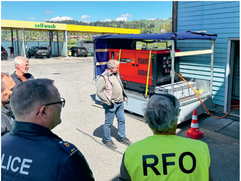
Notbetankung in Zollbrück: Gewappnet für den Krisenfall.

in der Lage sein, ihren Auftrag auch bei einem länger andauernden Stromausfall sicherzustellen. Zu diesem Zweck müssen die BORS sowie andere bevölkerungsrelevante Dienste und Personenkreise wie Feuerwehren, Zivilschutz, Rettungsdienste, Sicherheitsdienste, Behörden, Spitex-Organisationen und Weitere in der Lage sein, ihre mit Diesel und Benzin