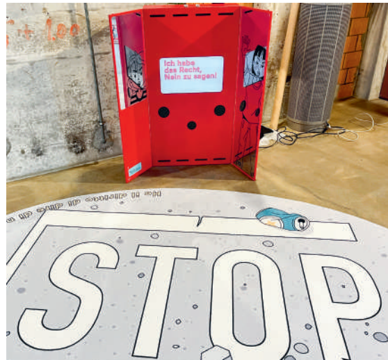
Kinder lernen im Präventionsparcours spielerisch Selbstschutz und Selbstvertrauen

Vom 28. Mai bis 2. Juni begleitet die Schulsozialarbeit Oberes Emmental die Schulklassen in Kleingruppen durch den interaktiven Parcours. An sechs Stationen üben die Kinder spielerisch Selbstschutzstrategien: Sie lernen, selbst zu bestimmen, wer ihnen nahekomen darf, auf ihre Gefühle und ihren Körper zu hören, zwischen guten und schlechten Geheimnissen zu unterscheiden sowie klar Nein zu sagen und bei Bedarf Hilfe zu holen. Ziel ist es, das Selbstbewusstsein der Kinder zu stärken. Eltern sind eingeladen, sich am offenen Nachmittag in der Ausstellung zu informieren und beraten zu lassen.