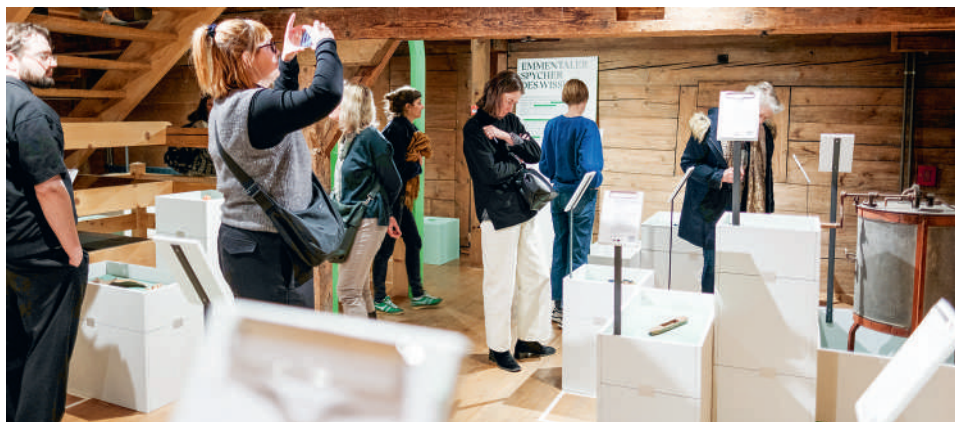
Im «spyhere!»-Projekt wird Alltagswissen aus dem Emmental gesammelt und sichtbar gemacht.

Das Geräusch der Webstühle in der alten Tuchfabrik. Ein dicker Stoffkatalog im Laden am Dorfplatz. Oder die Warnung vor dem «Aaschutz» an der Ilfis. Solche Erinnerungen und Erfahrungen sind Wissen von hier. Wissen, das oft nicht in Büchern steht, sondern in den Köpfen der Menschen steckt.