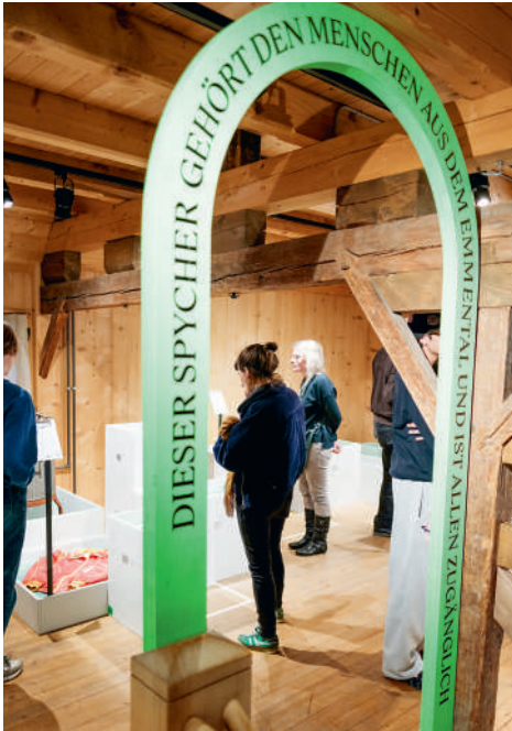
Erinnerungen, Begriffe und Geschichten: Wissen aus der Region wird erhalten und weitergegeben.

fabrik Zürcher einen wichtigen Treffpunkt mitaufbaute. Oder Erinnerungen an den Stoffladen im Sänglerhaus, wo Kund:innen früher durch dicke Musterbücher blättern, um den gewünschten Stoff auszuwählen.