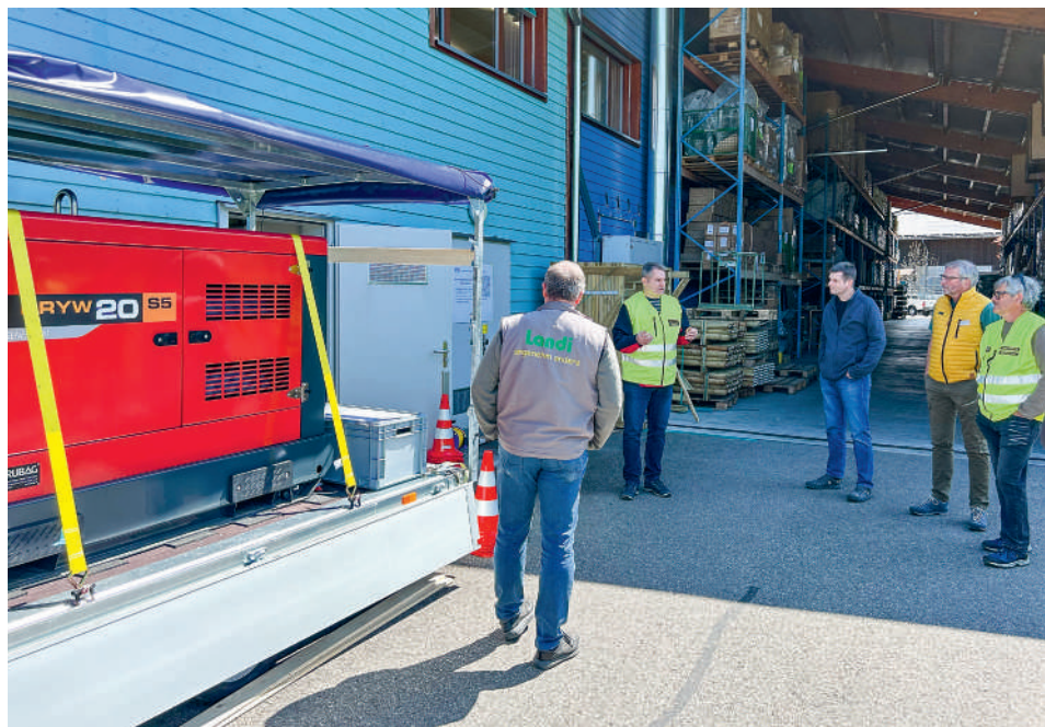
Vertretende der BORS informieren sich über Abläufe und Einsatzmöglichkeiten.

betriebenen Fahrzeuge zu tanken sowie Treibstoff für Notstromaggregate zu beziehen.