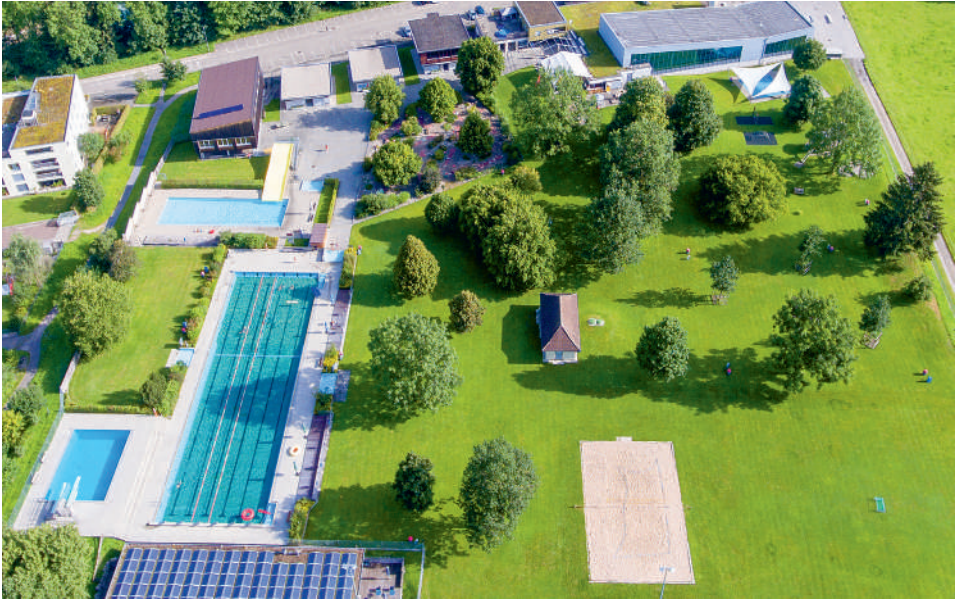
... und die Badi Langnau heute.