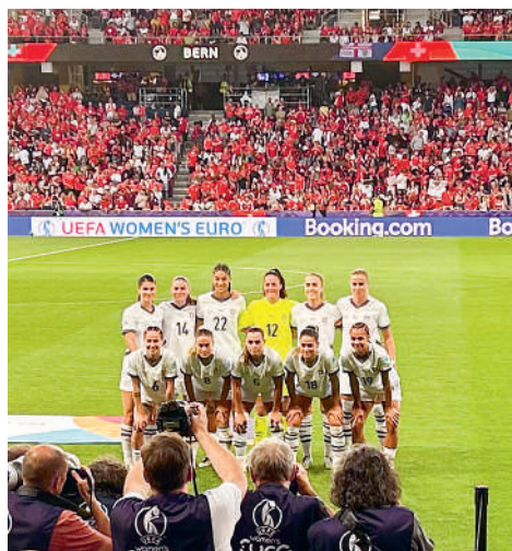
Frauen-Nationalteam an der WEURO2025