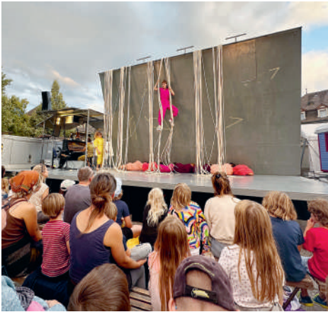
Beim Langnauer Zirkus-Festival 2026 (17. bis 21. Juni) wieder dabei: der Zirkus Chnopf.

chen serviert Chässchnitte und der Theater- und Kunstverein Risotto, und natürlich wird auch 2026 wieder gejazzt (Jazz Nights), gerockt (Elite Openair), getanzt (Tänzerei) und gehornt (Alphorn-Träff).